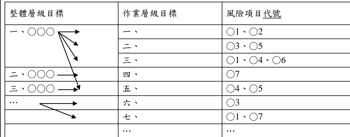
附表一 整體與作業層級目標及風險項目對應表